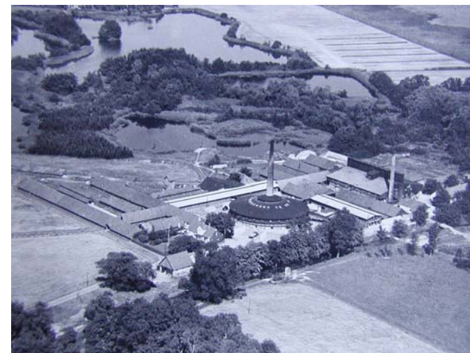
Nivaagaard Teglværk set fra sydvest 1938

Nivaagaard Teglværks Ringovn www.ringovn.dk