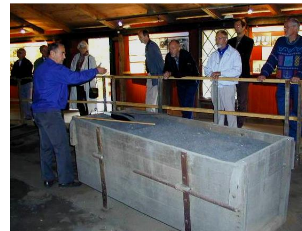
Der er rundvisning på alle åbningsdage. Her på brænderloftet, hvorfra brændingen blev styret.

Ringovnen fortæller historien om den teknologiske udvikling, der fra midten af 1800-tallet fandt sted i Danmark og i resten af Europa. Samtidig står den som repræsentant for et næsten forsvundet industrimiljø.