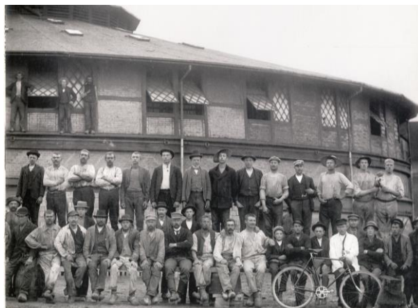
Teglværksarbejdere foran Ringovnen i 1904.

Nivaagaard Teglværk var områdets største arbejdsplads med over 100 medarbejdere.