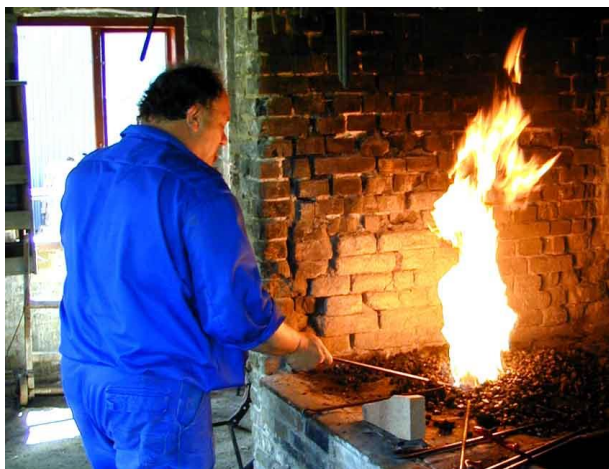
Smeden var som brænderen en nøgleperson på teglværket.

Teglværkets gamle smedje blev restaureret i 2006. Essen blev genopmuret, og de gamle mekaniske remdrevne værktøjer fungerer igen.