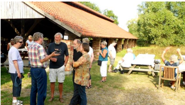
Tag madkurven med. Vi har borde og bænke.

Benyt også Ringovnen som udflugtsmål. Gåafstand til Nivåbugtens fuglereservat og til Nivaagaards Malerisamling og Park.