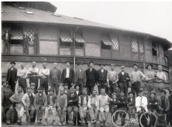
Teglværksarbejdere foran Ringovnen i 1904.

Mange af Københavns brokvarterer er opført af sten fra ringovnen, ligesom Sydsverige har været storftager af tegl fra Nivå. Nivaagaard Teglværk var områdets største arbejdsplads med over 100 medarbejdere.