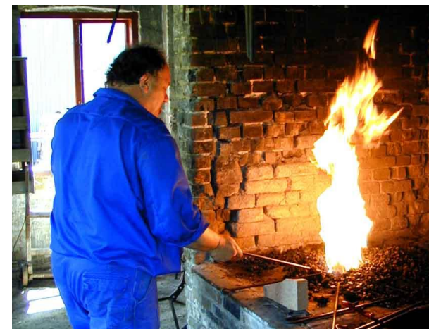
Smeden var som brænderen en nøgleperson på teglværket.

Teglværkets gamle smedje blev restaureret i 2006. Essen blev genopmuret, og de gamle mekaniske remdrevne værktøjer fungerer igen.