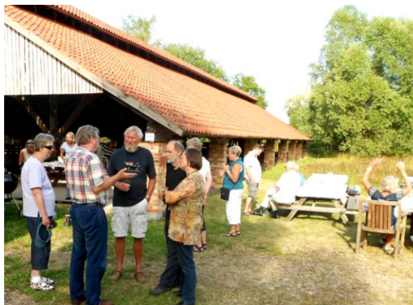
Sammenkomst ved Ringovnen.