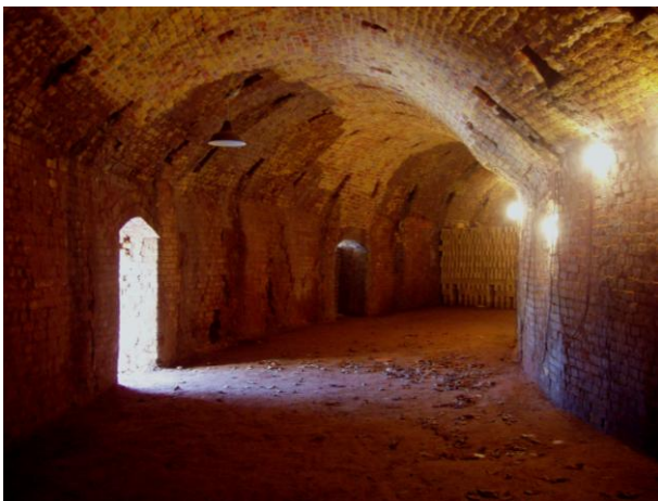
Den cirkelformede ovnhvælving.

De oprindelig cirkelrunde ovne blev banebrydende for teglværksindustrien, dels fordi de sikrede en uafbrudt brænding ved hjælp af en vandrende ildzone, og dels fordi den overskydende varme fra brændingen blev udnyttet til forvarmning af de tørrede teglprodukter.