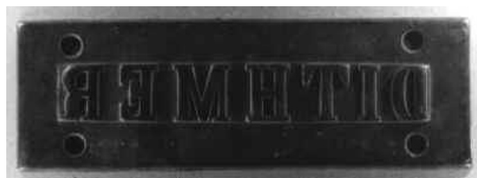
Stempelplade af jern fra Rendbjerg Teglværk

Kun få stempelplader til at præge navne med er bevaret. Een type består af en støbejernsplade, der boltes fast til presseapparatet, bogstaverne var støbt samtidigt med pladen. En anden type består af en støbt bronzeplade med støbte bogstaver. Pladen fæstnes med 4 skruer til en træplade, som derpå fæstnes til pressen. Denne type afslører sig ved et aftryk af skrukehovederne i det nedpressede felt omkring bogstaverne. Faktisk kan man ofte aflæse skrueskærvens stilling, og derved udskille sten presset til forskellig tid eller med forskellige stempler fra samme værk.