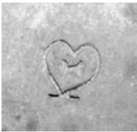
Bomærke fra teglværk i Lübeck området.

Det hører til sjældenhederne at finde stemplede senmiddelalderlige sten her i landet; men fra 1500-1700 årene har vi en del sten med bomærker fra især Lübecks teglværker