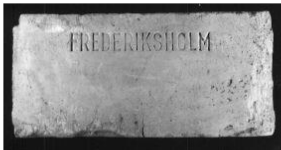
Mursten fra anden halvdel af 1900-tallet fra teglværkssammenslutningen Frederiksholm

Bygningsarkæologer og teglværkshistorikere holder meget af stemplede sten. Hvorfor glæder ikke alle teglværker os med at identificere deres sten? En gammel teglmester udtrykker det sådan: Der kan nu siges både for og imod at sætte sin signatur på stenene!