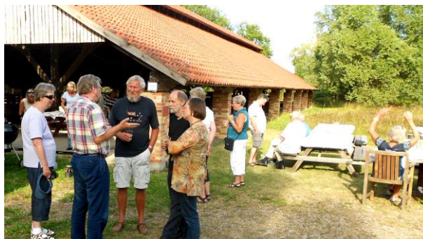
Tag madkurven med. Vi har borde og bænke.

Benyt også Ringovnen som udflugtsmål. Gåafstand til Nivåbugtens fuglereservat og til Nivaagaards Malerisamling og Park.