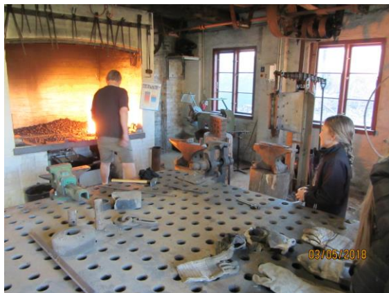
Smeden var som brænderen en nøgleperson på teglværket.

Teglværkets gamle smedje blev restaureret i 2006. Essen blev genopmuret, og de gamle mekaniske remdrevne værktøjer fungerer igen.